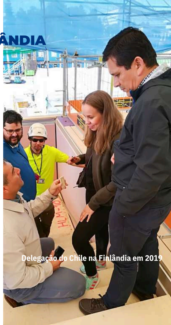
Delegação do Chile na Finlândia em 2019